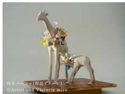
N.S. ハーシャ(作品イメージ) ©Artist and Victoria miro