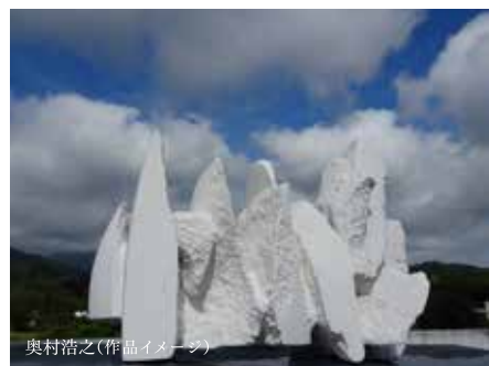
奥村浩之(作品イメージ)